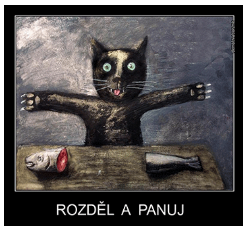
ROZDĚL A PANUJ

Takové jsou k tomuto okamžiku závěry boje kurátorů buržoazního liberalismu se směřováním národů Rusi ke kultuře lidskosti. Na jejich základě je možné udělat určité závěry.