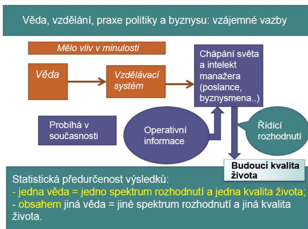
Ilustrace 1: Podmíněnost spektra řídicích rozhodnutí a budoucí kvality života vědou a vzdělávacím systémem.

system a vzdělávací systém v oblasti sociologie, politologie, ekonomiky a financí v Rusku je orientován na obsluhu liberálně-tržního ekonomického modelu v režimu kryptokolonie. To se týká i právních a vzdělávacích systémů jiných zemí. Proto pokud se opíráme o vzájemné vazby procesů, ukázané na ilustraci níže, pak v realizaci Ruského projektu globalizace není třeba narušovat příčinnno-důsledkové vazby jevů.